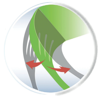
Tecnología de difusión de presión de 3M™.