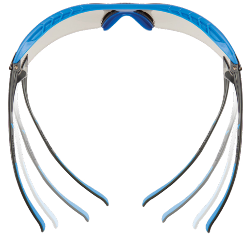
Tecnología de Difusión de Presión de 3M™.