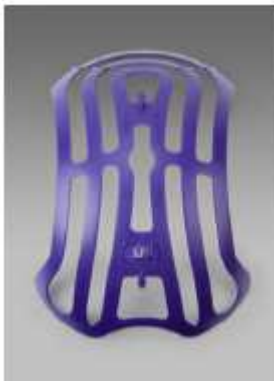
Cómoda Horquilla para ajuste de Arnés