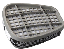
Filtro Línea 6000