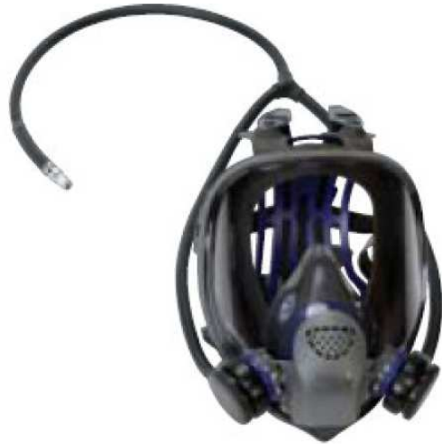
Respirador con Linea de Doble suministros de Aire