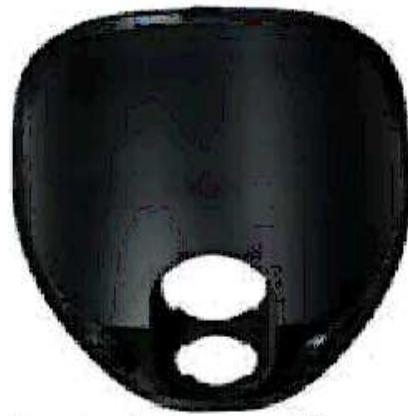
Lente sin Protección