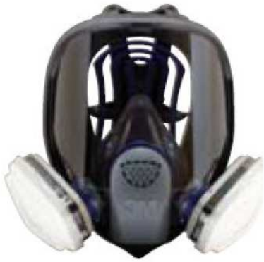
Respirador de Aire Purificador