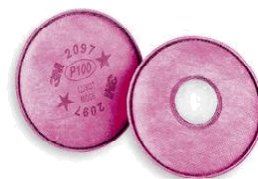
Filtro Línea 2000