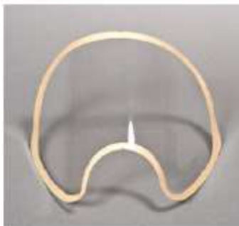
Protector de Lente Semi-permanente con Scotchgard